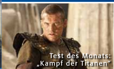
Test des Monats: „Kampf der Titanen“