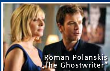
Roman Polanskis „The Ghostwriter“